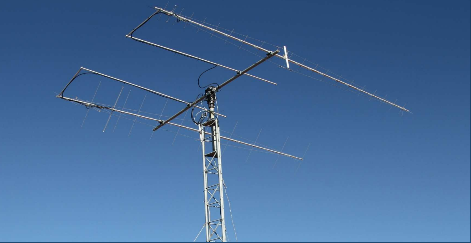
Türk Hava Kurumu Üniversitesi Yer İstasyonu Anteni