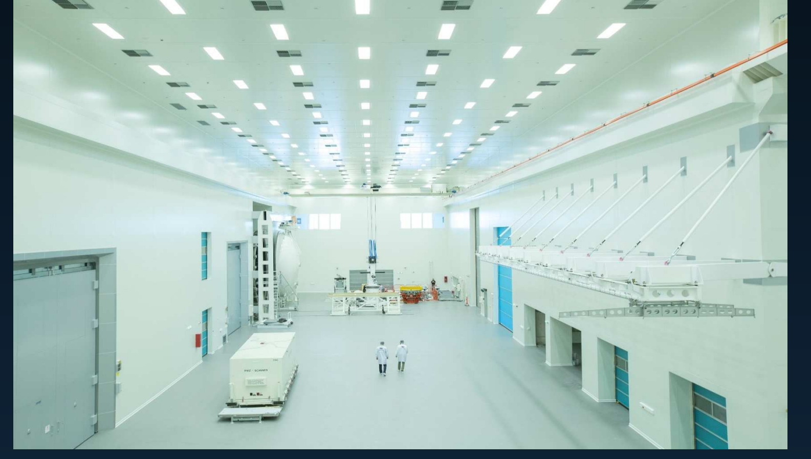
TUSAŞ Uzay Sistemleri Entegrasyon ve Test Holü