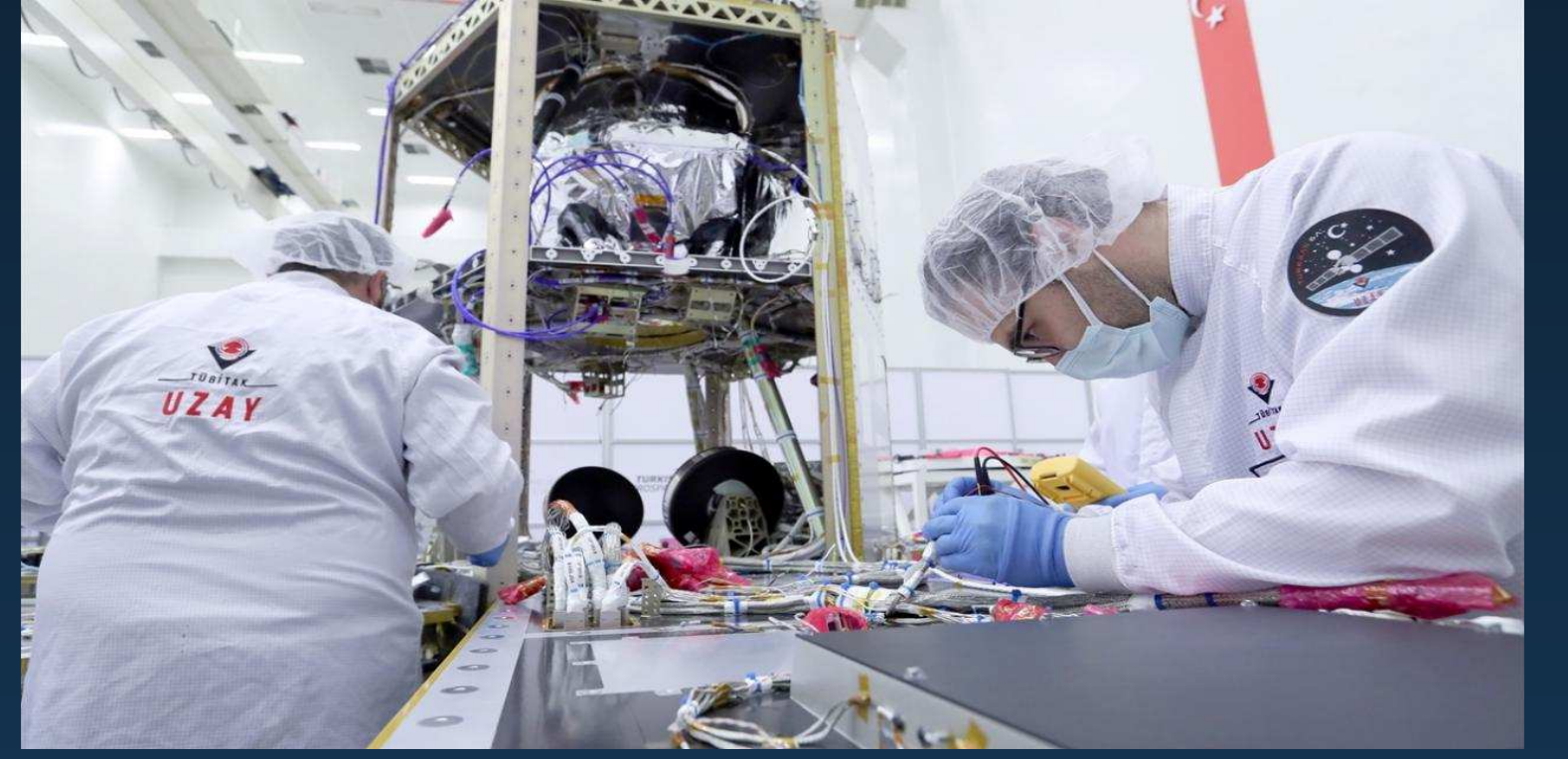
TÜBİTAK UZAY tarafından geliştirilen İMECE uydusu