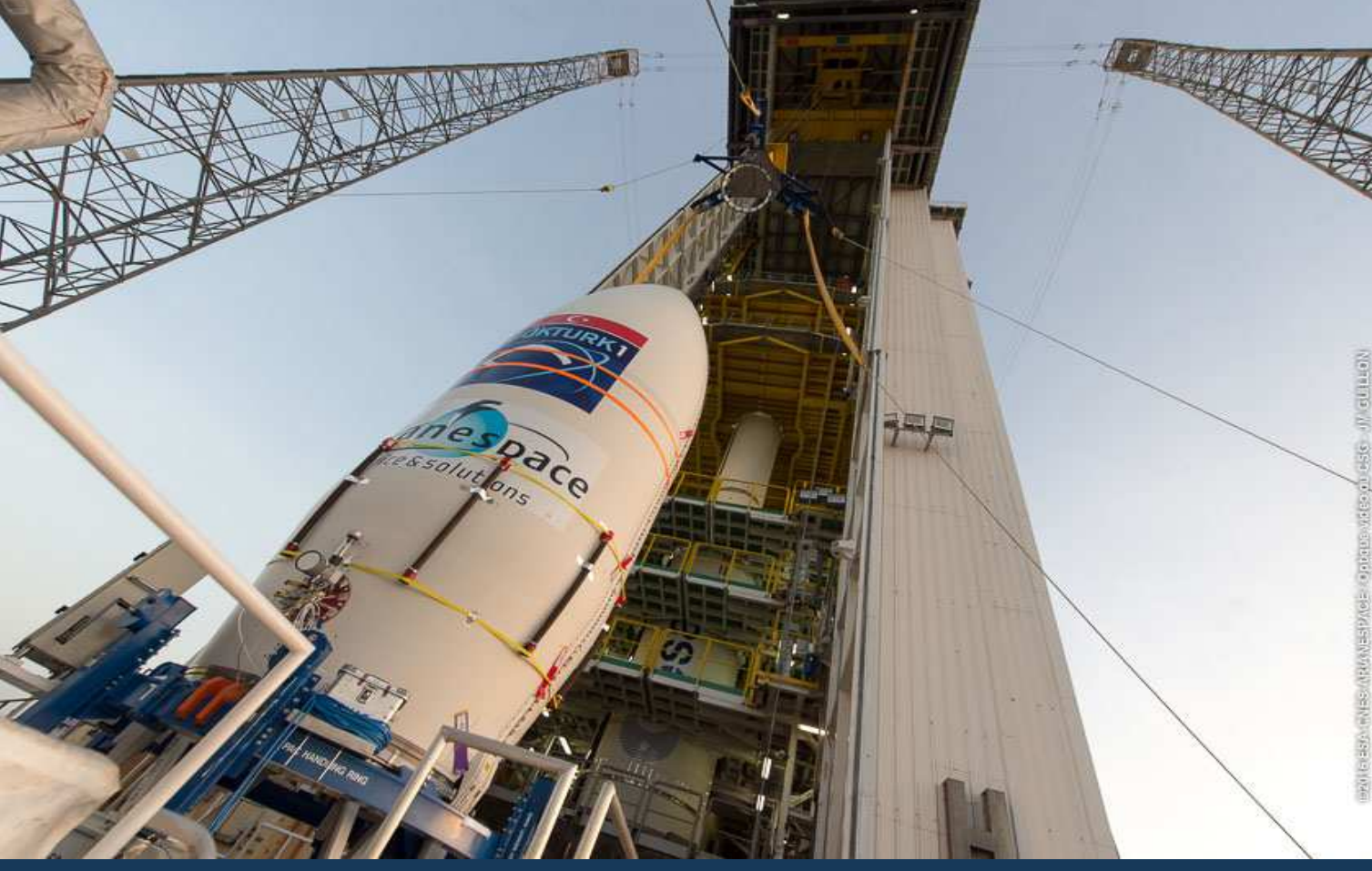
GÖKTÜRK 1 uydusu fırlatma rampasında